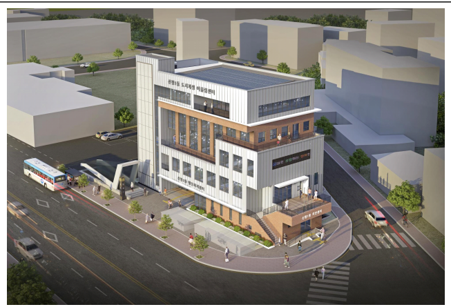
신평동 공동육아나눔터 (신평1동 도시재생어울림센터)