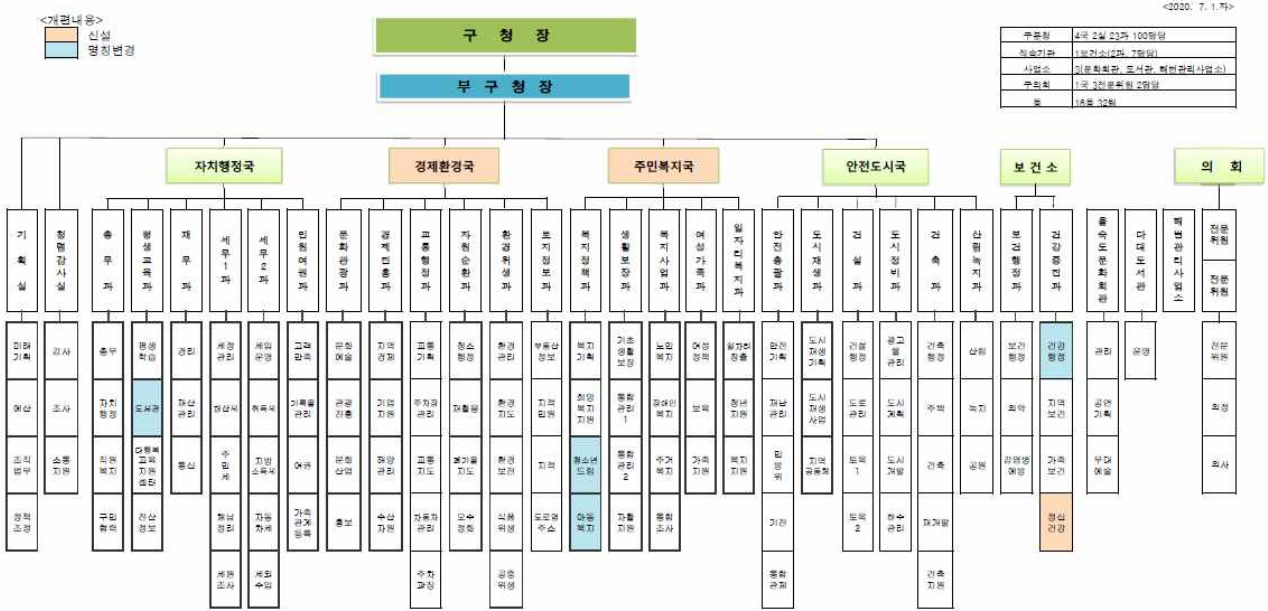
[동]- 16동, 32팀