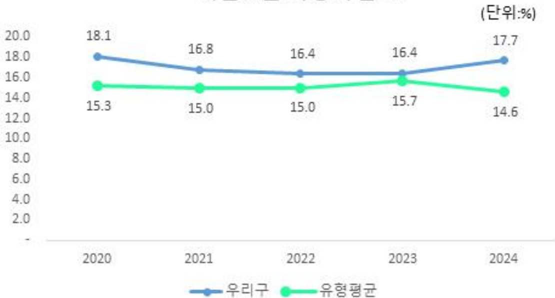
최근 5년 재정자립도

우리구의 재정자립도는 최근 감소 추세이나 동일 지자체 유형평균에 비해서는 높은 편입니다.